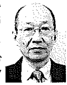
小田桐副署長 〔出身地〕 青森県 〔趣味〕 ゴルフ

〔メッセージ〕 藤沢税務署から異動してまいりました。どうぞよろしくお願いたしました。蒲田青色申告会の皆様方には、日頃から税務行政に対し、深い御理解と多大なる御支援を賜り、誠にありがとうございます。私どもとしましても、これまで同様でできる限りの協力をさせていただきますので、会の活動に関する課題など、何なりと御相談くださるようお願いいたします。