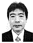
越前個人課税第1統括官 〔出身地〕 神奈川県 〔趣味〕 鎌倉・周辺散策

〔メッセージ〕 藤沢税務署から異動してまいりました。どうぞよろしくお願いたしました。蒲田青色申告会の皆様方には、日頃から税務行政に対し、深い御理解と多大なる御支援を賜り、誠にありがとうございます。私どもとしましても、これまで同様でできる限りの協力をさせていただきますので、会の活動に関する課題など、何なりと御相談くださるようお願いいたします。