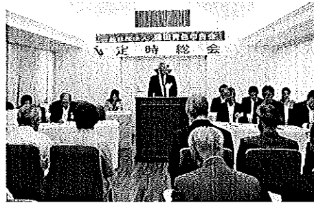
定時総会 (江川会長)