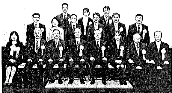
税務署長表彰受彰者