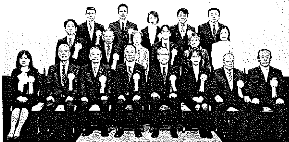
税務五団体長 感謝状受彰者