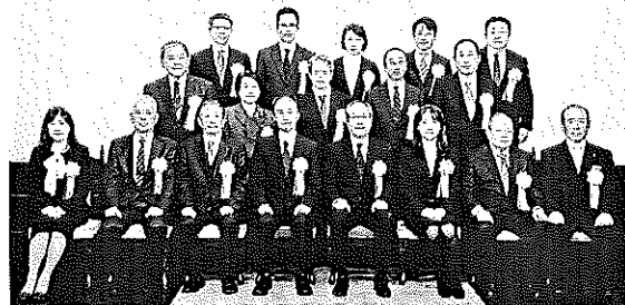
税務署長 感謝状受彰者