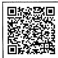
令和5年分所得税確定申告について

「令和5年分所得税確定申告について」・「令和5年分消費税確定申告について」を当会ホームページに記載しております。下記QRコードをご活用いただくと、簡便です。